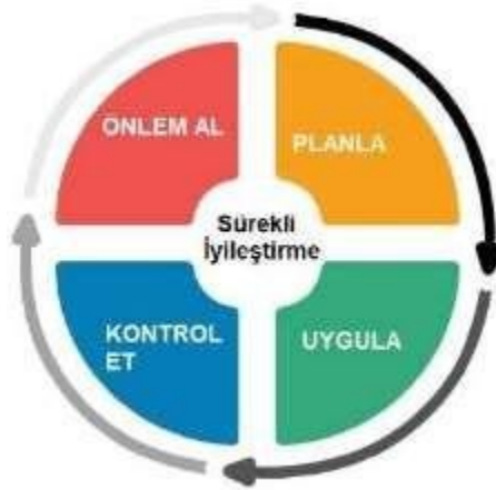
Şekil 1. PUKÖ Döngüsü

Yukarıda belirtilen adımlar özetle Planla-Uygula-Kontrol Et-Önlem Al (PUKÖ) yaklaşımı olarak ifade edilebilir